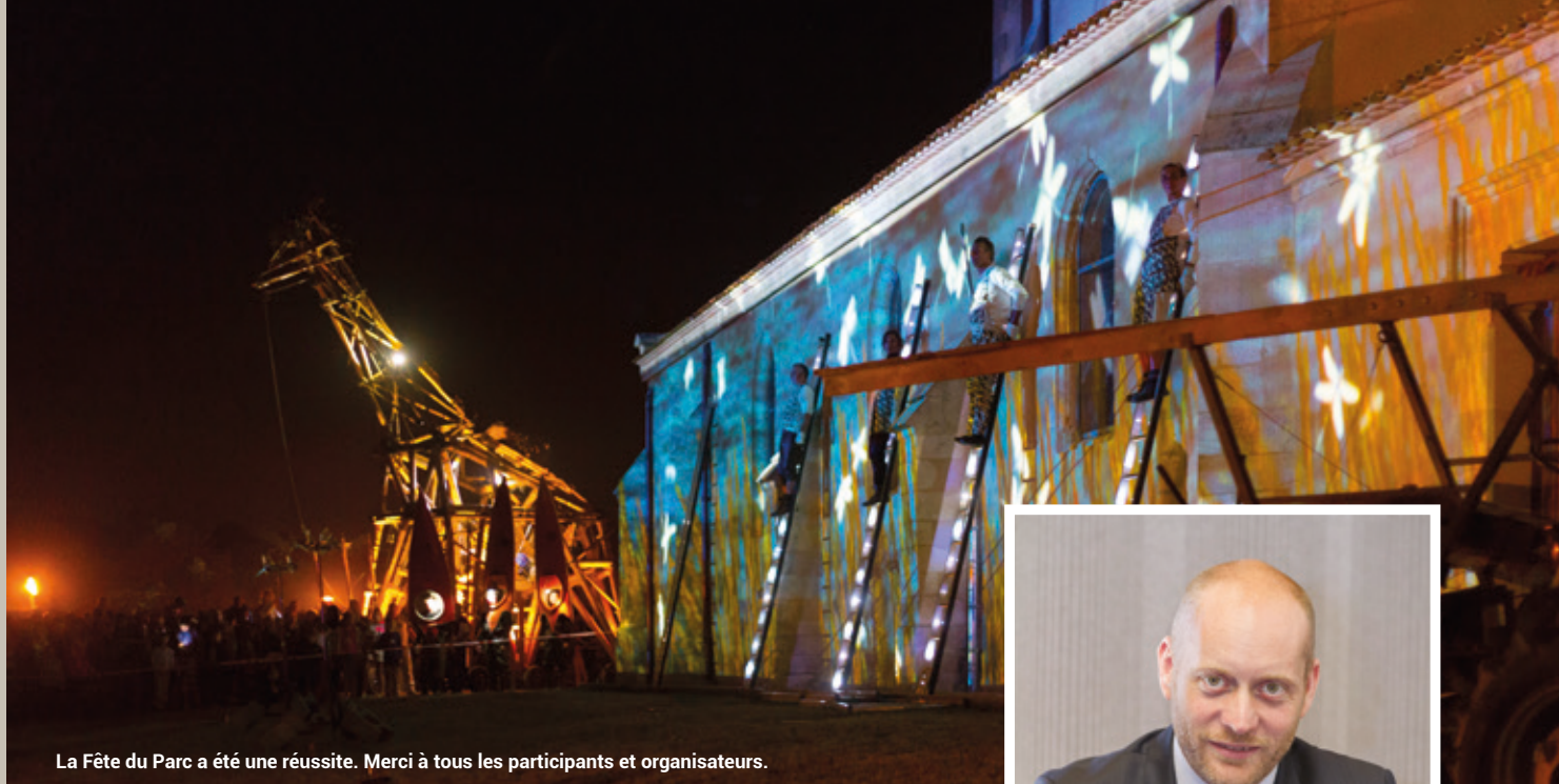
La Fête du Parc a été une réussite. Merci à tous les participants et organisateurs.