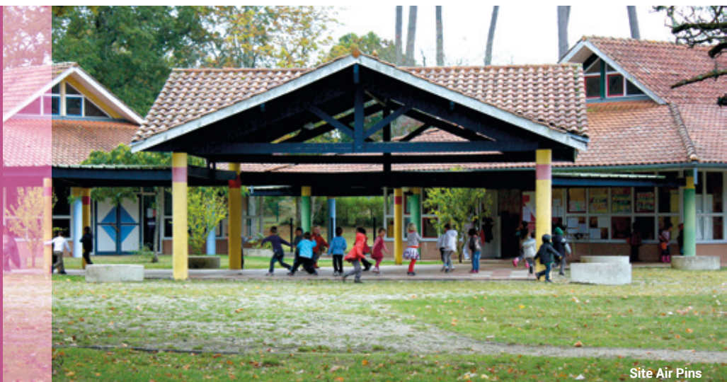
Site Air Pins