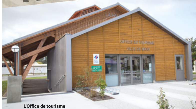
L'Office de tourisme

Ce livre, de quelque 160 pages illustrées, recense et explique pas moins de 400 toponymes. Présenté le 5 décembre (salle du 3 ème âge), il sera mis en vente lors du Marché de Noël, puis à l'Office de Tourisme, au prix de 15 €.