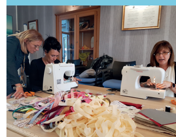
La salle des mariages transformée en atelier couture

Vous avez été nombreux à avoir déjà proposé vos services et nous vous en remercions mais nous avons encore besoin d'autres mains pour réaliser les 11 000 masques qui seront ensuite distribués aux Miossais. Nous comptons sur votre mobilisation !