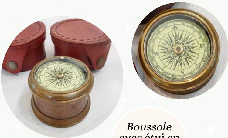
Boussole avec étui en cuir 18 €