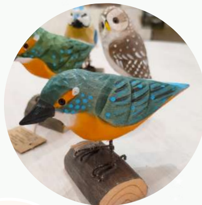
Oiseau en bois sur ped 9,50 €