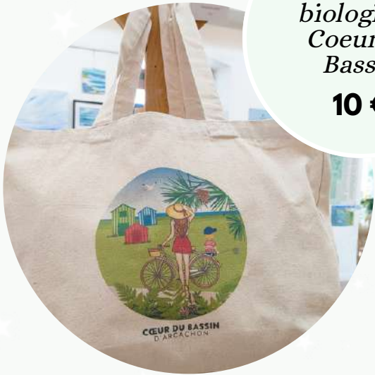
Cabas en coton biologique Coeur du Bassin 10 €