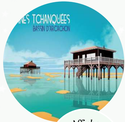
Affiche Bassin d'Arcachon 70x40 14,50 €

Production locale issue de la forêt du Bassin