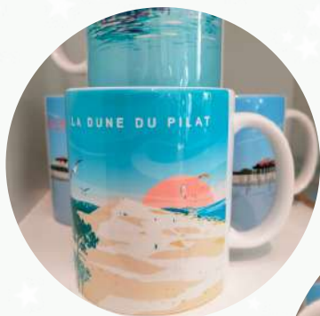
Mug Bassin d'Arcachon