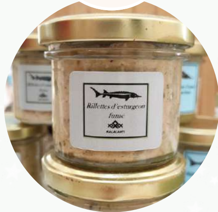
Kalalahti Artisan Maître Fumeur production locale