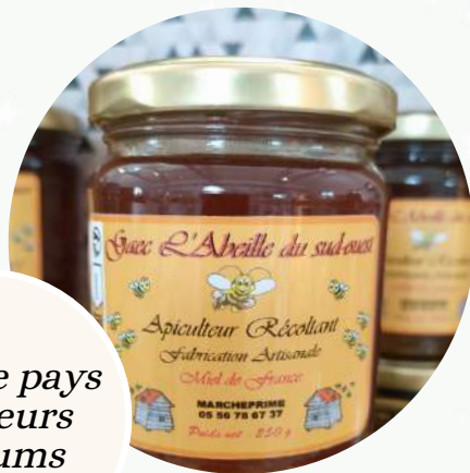
Miel de pays plusieurs parfums 6 €

Ruches situées en Gironde, en Dordogne et dans les Landes.