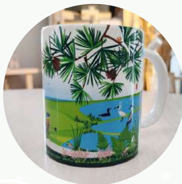
Mug Coeur du Bassin