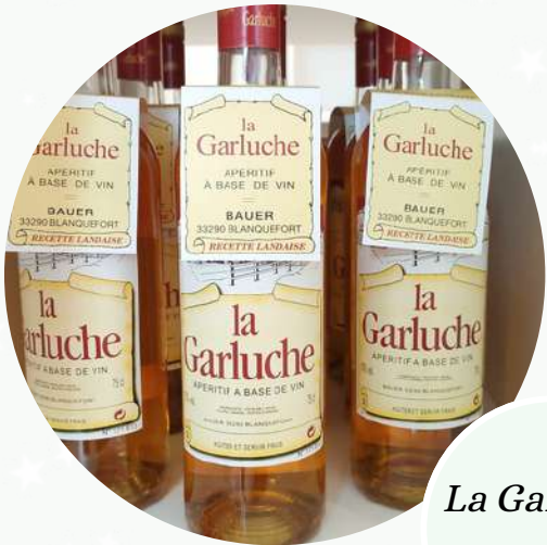
La Garluche 16,50 €

Apéritif local à base de vin blanc - recette landaise -