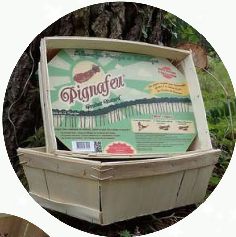
Pignafeu allume-feu naturel 100% local 9,50 €