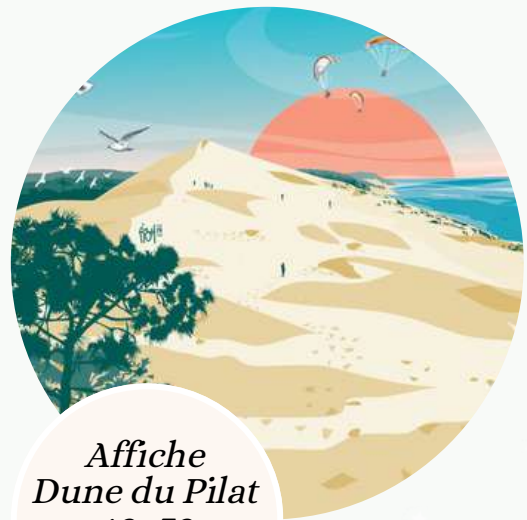
Affiche Dune du Pilat 40x70 14,50 €